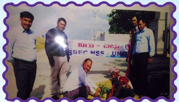
Tree plantation program on 26-08-2016