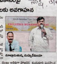
వ్యక్తిత్వ వికాసంపై అవగాహన

పాఠ్యం: మండల పరిధిలోని నెరవాడ మెట్ట వద్ద ఉన్న శాంతిరామ్ ఇంజనీరింగ్ కళాశాలలో సోమవారం వ్యక్తిత్వ వికాసంపై అవగాహన సదస్సు నిర్వహించారు. ఈ సందర్భంగా ఆయన మాట్లాడుతూ వ్యక్తిత్వ వికాసంపై అవగాహన సదస్సు నిర్వహించారు. ఈ సందర్భంగా ఆయన మాట్లాడుతూ వ్యక్తిత్వ వికాసంపై అవగాహన సదస్సు నిర్వహించారు.