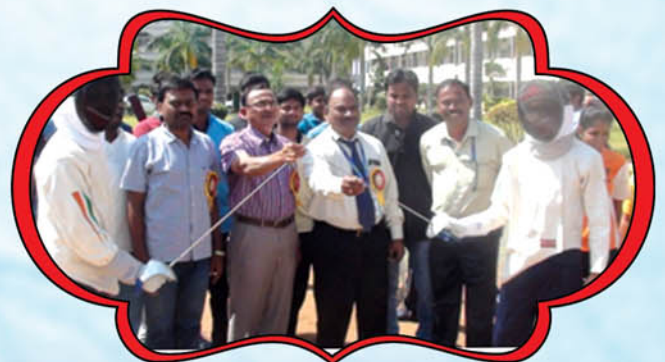
CONDUCTED JNTUA FENCING TEAM (M& W)SELECTION TRAILS