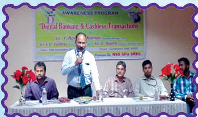
Seminar on Digital Banking & Cashless Transactions on 16-12-2016 with SBI Manager, RGM CET