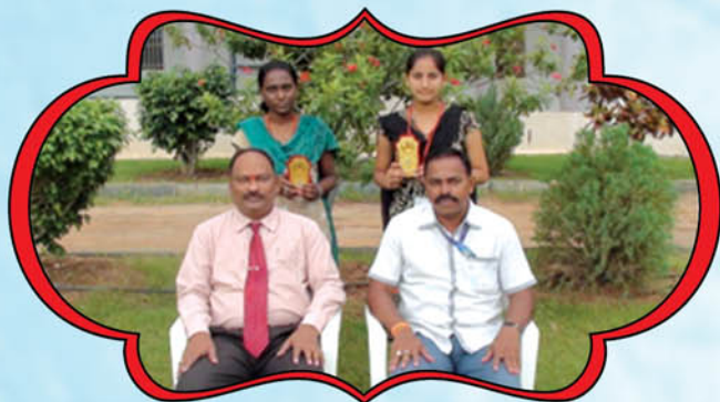
PARTICEPATED IN SOUTH ZONE CHESS CHAMPION SHIP