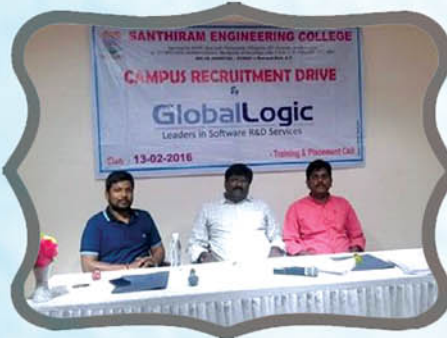
Global Logic, Hyderabad on 13/07/2016