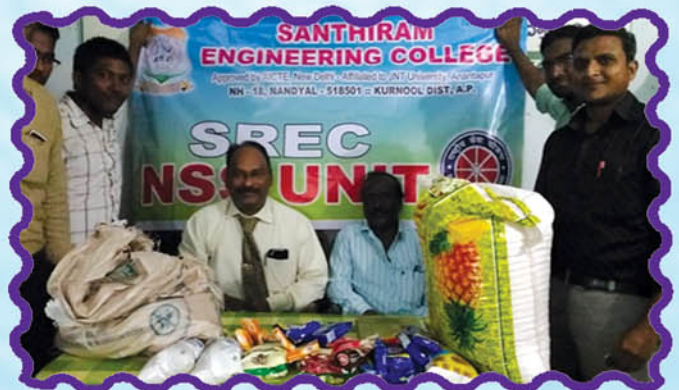
SREC NSS unit Donated Food Kits to Blind Students