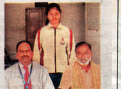
విద్యార్థిని అభినందిస్తున్న ప్రెసిడెంట్, పీఠ