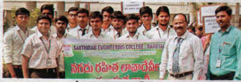
రూలి నిర్వహిస్తున్న శాంతిరామ్ విద్యార్థులు