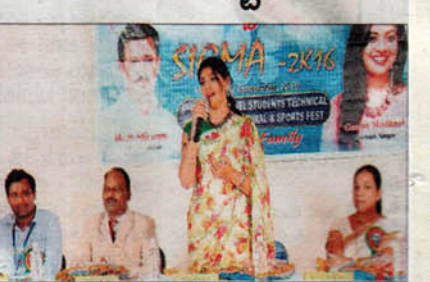
మాట్లాడుతున్న గాయని గీతామాధురి