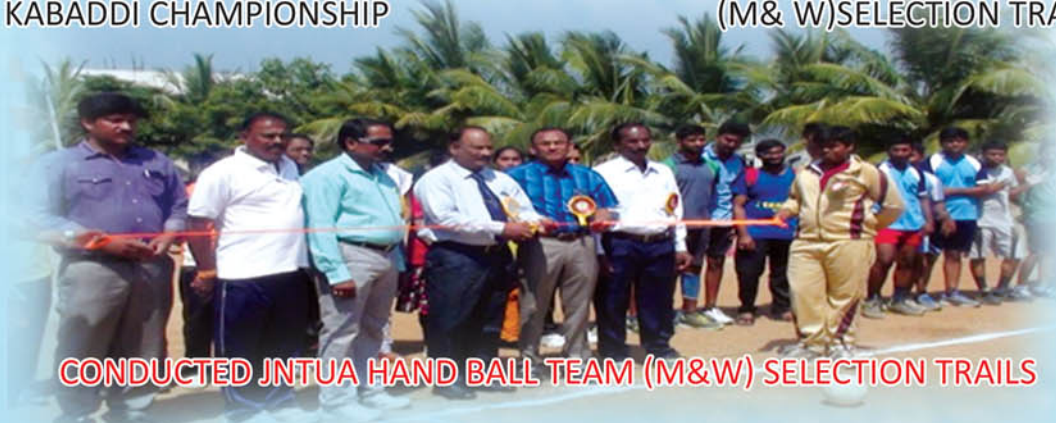
CONDUCTED JNTUA HANDBALL TEAM (M&W) SELECTION TRAILS