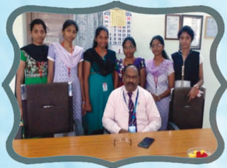
NLP TECHNOLOGIES on 20-12-2016