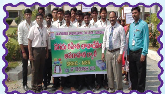
Awareness on Cashless transactions on 29-12-2016 at Panyam