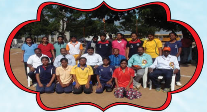
HAND BALL TEAM