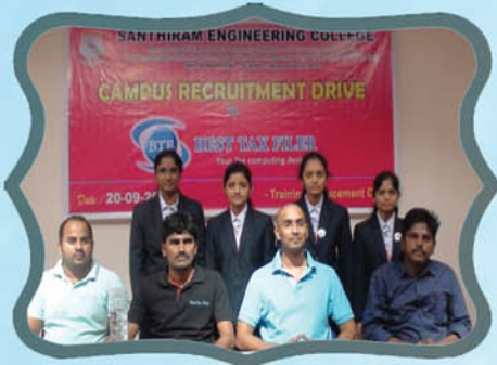
BEST TAXFILER HYDERABAD on 20-09-2016