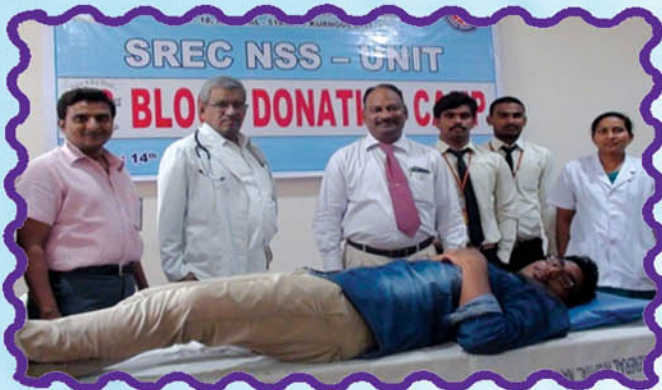
Blood Donation Camp on 14-07-2016 at SREC.

SREC has two NSS units, in which one is funded by the University, and the other is self funded Unit. It is the regular practice to conduct the programmes, awareness programmes, rallies etc., on behalf of SREC-NSS units. The following are the few programmes organised by the units in during July to Dec of 2016.