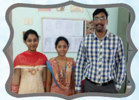
ADVENT GLOBAL HYDERABAD on 24-12-2016