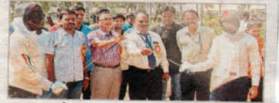
ఫెస్టివల్ పోటీలను ప్రారంభిస్తున్న దృశ్యం

పాఠ్యం: మండల పరిధిలోని నెరవాడ మెట్ట వద్ద ఉన్న శాంతిరామ్ ఇంజనీరింగ్ కళాశాలలో సోమవారం ఫెస్టివల్ ఎంపిక పోటీలు ప్రారంభమయ్యాయి. ఈ పోటీలకు జేఎన్టీయూ స్టూడెంట్ హ్యాండ్బాల్ జట్టు ప్రాధాన్యత. వివిధ కళాశాల నుంచి సుమారు 500 మంది బాల బాలికలు వచ్చారు తెలిపారు. సాయంత్రం వరకు జరిగిన ఈ పోటీల్లో 18 మంది విద్యార్థులు ప్రతిభ కనబరచారు. ప్రతిభ కనబరిచిన క్రీడాకారులు డిసెంబర్లో అమ్మత్వంలోని గంగానాథ్ యూనివర్సిటీలో జరుగిన ఆర్ ఇండియా ఫెస్టివల్ పాల్గొంటారన్నారు.