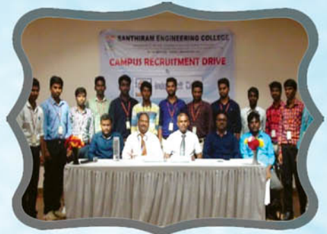
INDOSHELL CAST COIMABOTORE on 27-09-2016