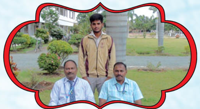
PARTICEPATED IN SOUTH ZONE CRICKET CHAMPION SHIP