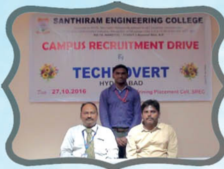
TECHNOVERT HYDERABAD ON 27-10-2016