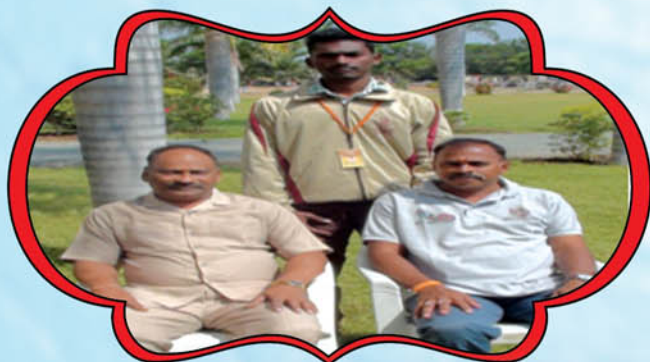
PARTICEPATED IN SOUTH ZONE KABADDI CHAMPIONSHIP