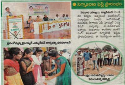
సూతీస్ ఆరోచిసీలతో ముందుకు సాగాలి

పాఠ్యం: మండల పరిధిలోని నెరవాడ మెట్ట వద్ద ఉన్న శాంతిరామ్ ఇంజనీరింగ్ కళాశాలలో సోమవారం సూతీస్ ఆరోచిసీలతో ముందుకు సాగాలి అనే ప్రాజెక్టును ప్రారంభించారు. ఈ ప్రాజెక్టులో విద్యార్థులు సూతీస్ ఆరోచిసీలతో ముందుకు సాగాలి అనే ప్రాజెక్టును ప్రారంభించారు. ఈ ప్రాజెక్టులో విద్యార్థులు సూతీస్ ఆరోచిసీలతో ముందుకు సాగాలి అనే ప్రాజెక్టును ప్రారంభించారు. ఈ ప్రాజెక్టులో విద్యార్థులు సూతీస్ ఆరోచిసీలతో ముందుకు సాగాలి అనే ప్రాజెక్టును ప్రారంభించారు.